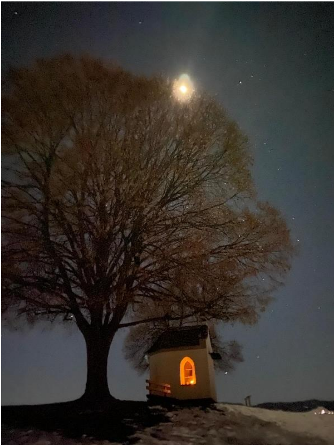
Motiv: „Weißenberger Halde bei Nacht“